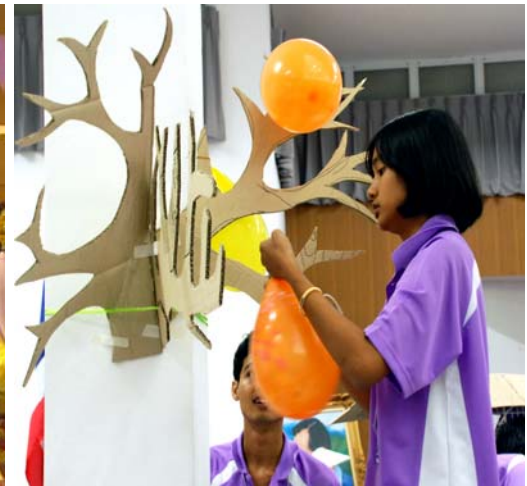
สภาองค์การพัฒนาเด็กและเยาวชน ในพระราชูปถัมภ์สมเด็จพระรัตนราชสุตาฯ สยามบรมราชกุมารี